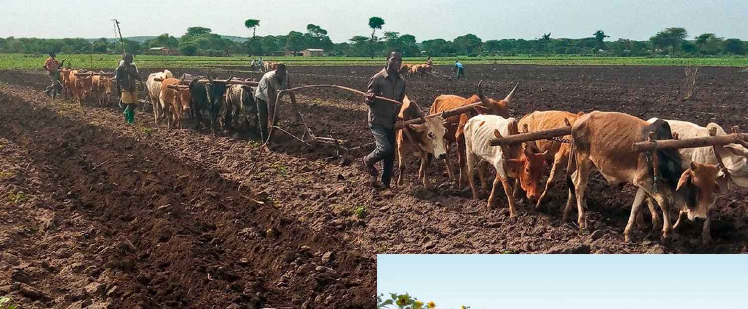
▲ Im Nordwesten Tansanias bereiten Baumwollbauern ihre Felder für die Aussaat von Bio-Baumwolle vor.