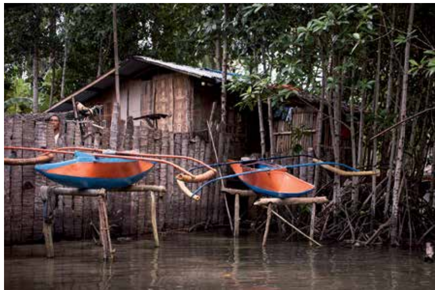
oben: Traditionelle Fischerboote der Indigenen auf Samal Island

Zudem häuften sich Berichte über Menschenrechtsverletzungen, die an Mitgliedern der indigenen Gemeinschaften der Philippinen und insbesondere an den Lumads auf der Insel Mindanao im Süden der Philippinen begangen wurden. Indigene Lumads geraten dabei vor allem zwischen die Fronten des innerstaatlichen Konflikts zwischen philippinischer Regierung und dem Aufstand der kommunistischen New People's Army (NPA). Unabhängige Indigenenschulen werden systematisch von Militär und Paramilitärs verdächtigt, als Ausbildungslager der NPA zu dienen, und aus diesem Grund angegriffen. Bergbauvorhaben und Großplantagen auf indigenen Gebieten sind ein weiterer Grund für Vertreibung. Paramilitärische Gruppen können hier ihre eigenen wirtschaftlichen Interessen unter dem Deckmantel der Aufstandsbekämpfung ungestört durchsetzen.