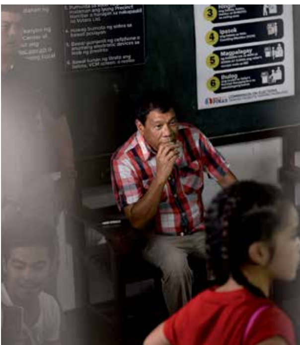
links: Präsident Rodrigo Duterte