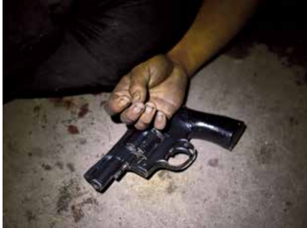
Die Polizei wird beschuldigt, den Todesopfern Waffen unterzuschieben