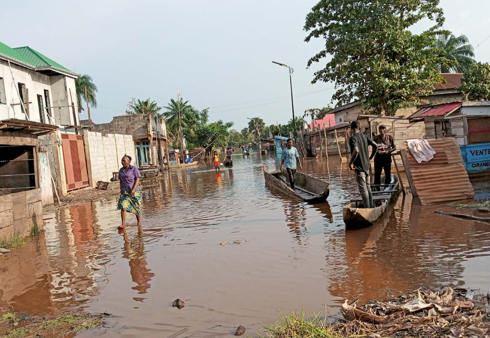
Überflutung in Mbandaka Town, Équateur Region in der DR Kongo, 2024.

gen aus Kamerun, Indonesien und weiteren Regionen zeigen, wie kirchliche Strukturen vor Ort eine entscheidende Rolle spielen können – gerade dort, wo staatliche Hilfe nur eingeschränkt verfügbar ist.