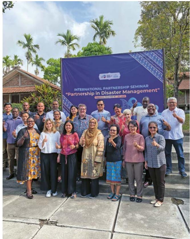
Die Teilnehmenden des VEM-Workshops Disaster Management in Indonesien, 2023.

Die VEM verfolgt dabei einen ganzheitlichen Ansatz: Katastrophen betreffen nicht nur die Infrastruktur, sondern auch das soziale, psychische und spirituelle Leben von Menschen und Gemeinschaften. Katastrophenhilfe versteht die VEM als gemeinschaftliche Aufgabe, die Bildung, Solidarität, praktische Unterstützung und seelsorgerliche Begleitung verbindet. So entsteht innerhalb der VEM-Gemeinschaft ein starkes Netzwerk von Kirchen, die voneinander lernen und gemeinsam daran arbeiten, die Folgen von Katastrophen zu lindern – getragen von der Überzeugung, dass wirksame Katastrophenhilfe lange vor dem Ernstfall beginnt und niemanden ausschließen darf. ■